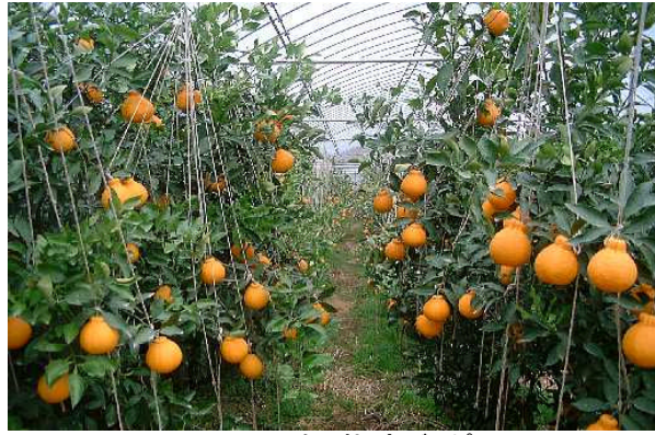
ハウス栽培デコポン